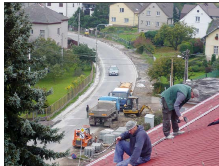
Fotografie z instalace fotovoltaické elektrárny na střeše ZŠ připomíná i budování chodníků a parkoviště u školy.

S přibývajícím slunečním dnem se zvyšuje výkonnost fotovoltaické elektrárny na střeše základní školy v Krásném Poli. Od měsíce března již elektrárna neprodukuje elektřinu jen pro vlastní spotřebu základní školy, ale začala ve větším množství dodávat přebytky i do sítě. Vlastní spotřeba se účtuje tzv. zeleným bonusem prostřednictvím firmy ČEZ, přebytky prodáváme prostřednictvím obchodníka, který nám jinak elektřinu dodává – tedy přes firmu Bicorn.