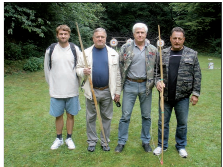
Družstvo Krásného Pole v lukostřelbě

Plesná sety 2-2, míče +3 Horní Lhota sety 2-2, míče -2 Těškovice sety 2-2, míče -1