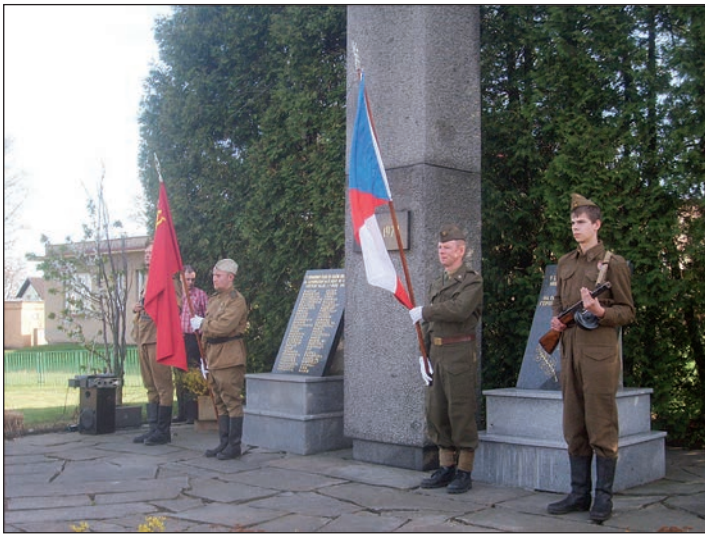
Památník obětem II. světové války bude v rámci výstavby MŠ přemístěn na místní hřbitov

studie. A ta opravdu prokázala, že nárazově je hladina hluku, i když velice mírně, nad úrovní, kterou vyžaduje norma. Nicméně tatáž hluková studie potvrdila, že výstavbou protihlukové stěny, která by nahradila plot podél Družební, je úroveň hluku s výraznou rezervou pod hranicí normy. Takže už bylo pouze na architekttech, jak ztvárnit hlukovou zábranu, aby zároveň tvořila přívětivou a pro vnímavé dětské oko zajímavou kulisu. Ve spojení se zahradními úpravami (keře, stromy, popínavé rostliny) lze předpokládat, že se dočkáme zajímavého a estetického výsledku i při pohledu z ulice.