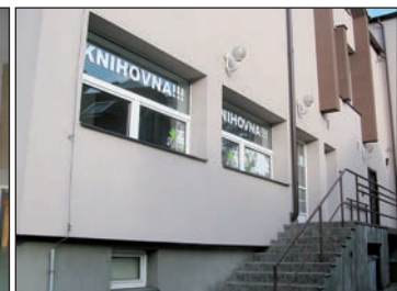
Knihovna - pohled zvenčí