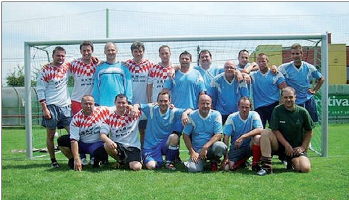
Ve finále se střetly týmy Horního a Středního konce

Tradiční každoroční akce KRPOL hockeyball CUP má od letošního roku svou fotbalovou variantu. V sobotu 23. 6. 2012 se uskutečnil 1. ročník turnaje v malé kopané, kdy se stejně jako v hokejové podobě střetly týmy „Horního konce“, „Dolního konce“, „Středního konce“ a „Kuferkářů“ v boji o KRPOL CUP 2012.