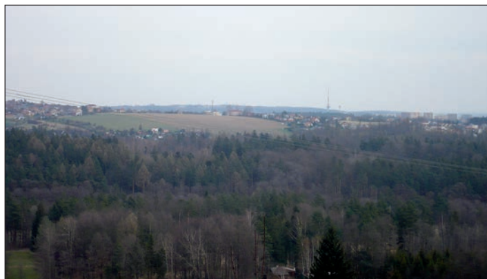
Pohled na Krásné Pole od Čavisova

** Vraťme se k těm letošním stavbám. Jak například občané snášeli dlouhodobou uzavěru ulice Krásnopolské. Slyšel jsem