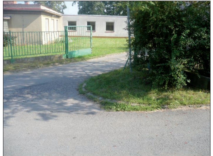
Pohled na starou školní jídelnu, v místě dnešních vrat bude roh nové budovy mateřské školky

Pokud jste dočetli až sem, možná že jste si už všimli, že jsem v tomto článku neuváděl žádné konkrétní jméno. Slibuji, že na to bude prostor v dalších vydáních Krasničanu, v průběhu výstavby a po – doufám, že úspěšném – dokončení stavby. Tímto způsobem psaní jsem chtěl tak trošku symbolicky naznačit, že tento obrovský úspěch – kterým bezesporu realizace mateřské školy v Krásném Poli je – patří všem. I těm, kteří to ani nevědí nebo si to nepamatují. Všem, kdo podepsali v roce 2008 petici za záchranu školky, autorům kupletu, který zazněl při Chování basy