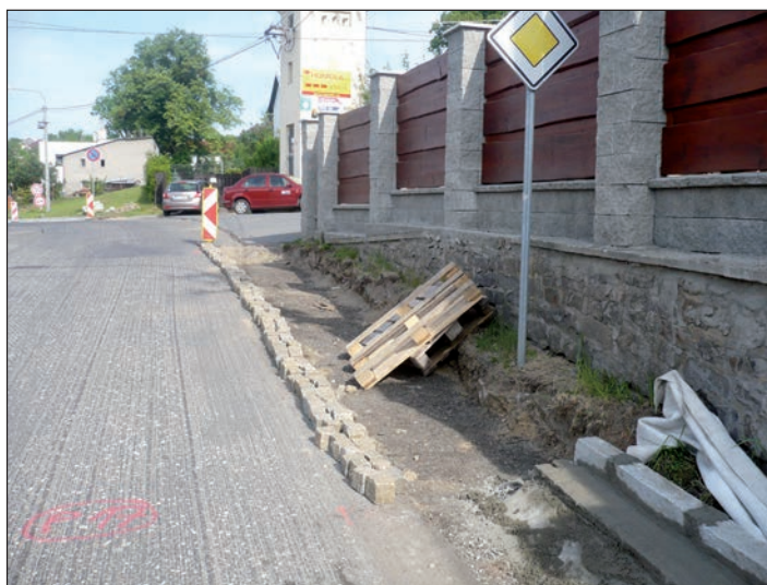
Oprava ulice Krásnopolské