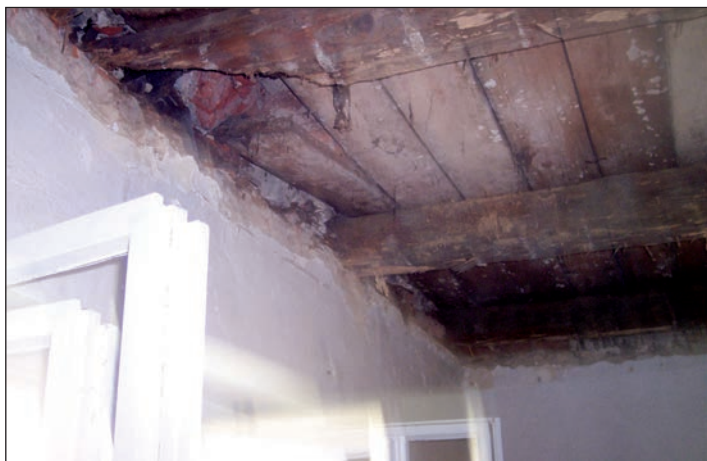
Foto z havárie stropu z roku 2008

Podstatné však je, že budova v posledních desetiletích, přes rozsáhlé opravy a renovace, již nevyhovovala technickým, morálním a hlavně hygienickým nárokům, kladeným na předškolní zařízení. Paspport školních zařízení města Ostravy, který byl proveden v roce 2008, konstatoval, že budova MŠ Krásné Pole patří mezi tři nejhorší školní budovy na celém území města! Časté zde byly havárie odpadů, zdi trpěly vysokou vlhkostí, k nejhorším pak patřily havárie stropů, z nichž ta poslední – v roce 2008 – zapříčinila téměř uzavření školky v Krásném Poli – ze zpětného pohledu si troufám říci, že by se tak stalo navždy.