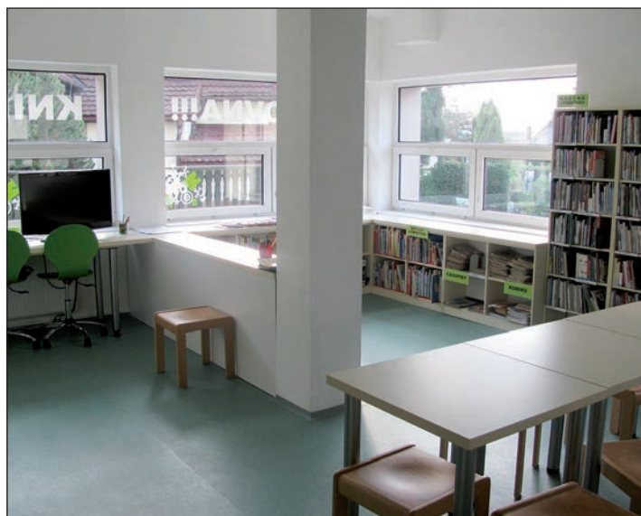
Knihovna - část pro děti

Opavská, L. Poděště, Podroužkova, Vietnamská, Svinov, Polanka, Krásné Pole