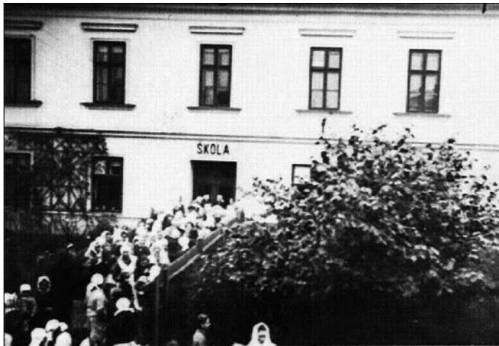
Demonstrace žen u obecné školy - dnešní Mateřské školy na ulici Družební - v r.1938

M ateřská škola působí v současné budově od roku 1961, kdy byla uvedena do provozu současná základní škola. Již tehdy – na počátku šedesátých let – měla za sebou tato budova téměř devadesátiletou historii. V následujících padesáti letech až do současnosti prošla budova mnoha opravami a přestavbami, takže z její původní secesní podoby nezůstalo téměř nic.