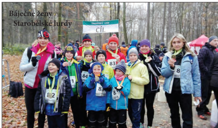
Báječné ženy - Starobělské ludy