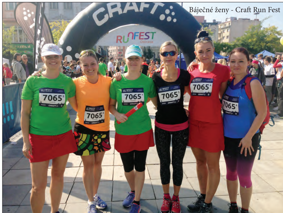
Báječné ženy - Craft Run Fest

Závod štafet 6 závodnic, při kterém každá účastnice uběhne 6,5 km krásným parkem Komenského sadů. Děvčata si zvolila vskutku originální