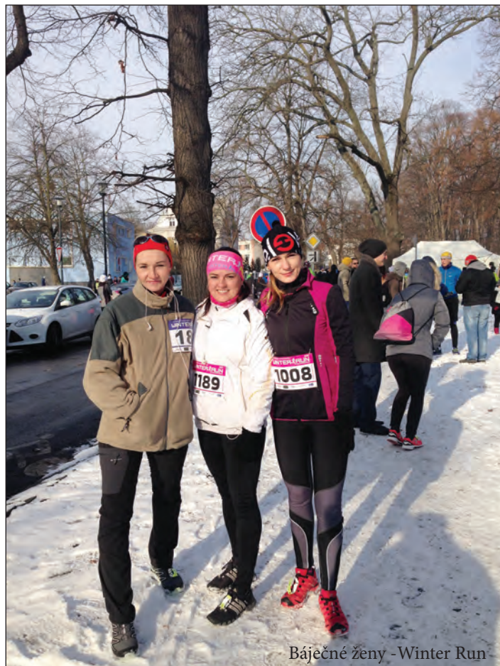
Báječné ženy - Winter Run