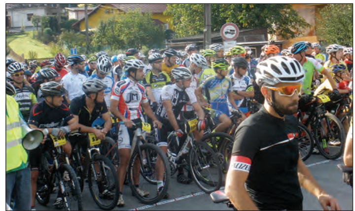
Závodníci na startu