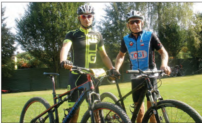
Naši reprezentanti v cyklistice