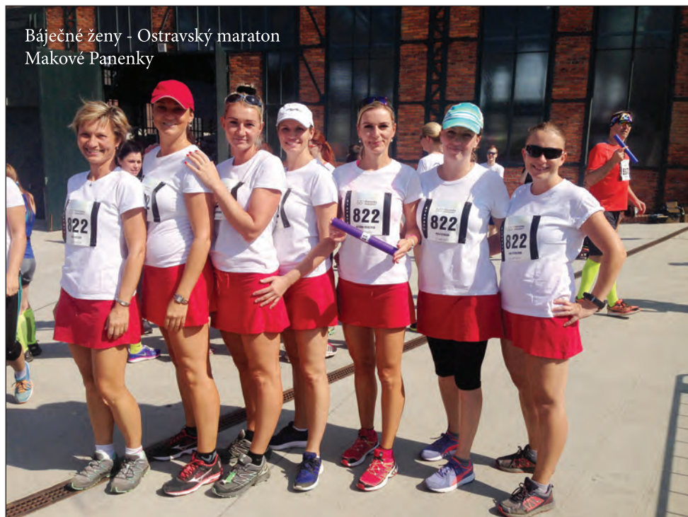
Báječné ženy - Ostravský maraton Makové Panenky