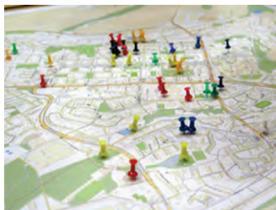
Foto: Pocit bezpečí ve městě se dá zkoumat různými způsoby

Tým složený z pracovníků VŠB – Technické univerzity Ostrava (Hornicko-geologická