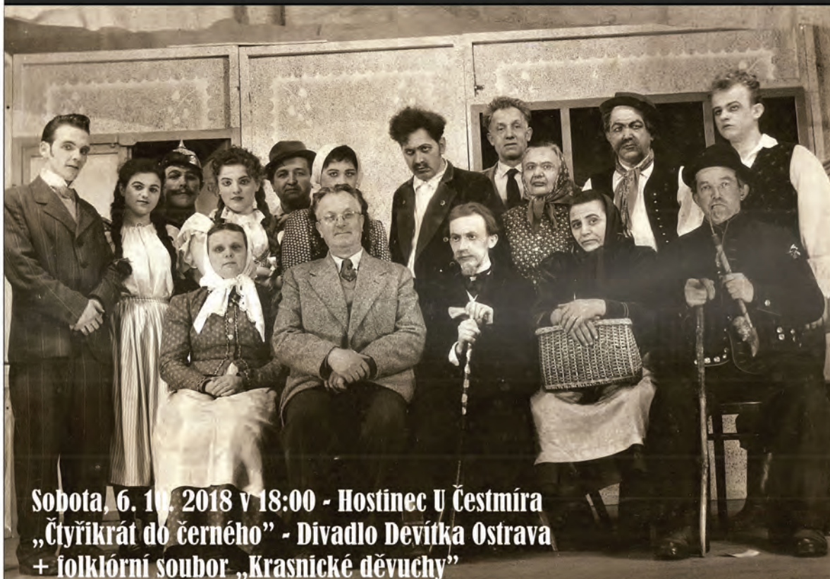
Krasničtí amatéři v 50. letech minulého století.

Sobota, 6. 10. 2018 v 18:00 - Hostinec U Čestmíra „Čtyřikrát do černého” - Divadlo Devítka Ostrava + folklórní soubor „Krasnické děvuchy”