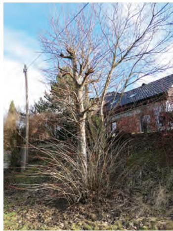
Poškozené stromy, u kterých zvažujeme podání podnětu na Magistrát města Ostravy

bez stavebního povolení a obnova a vytváření tůň a mokřadů.