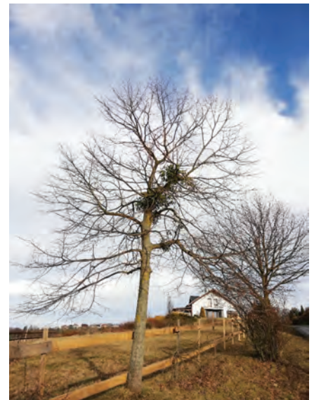
Začínající výskyt jmelí v koruně

vysokých vozidel pro svoz odpadu) budou u mladších stromů ořezávány i některé větve směrem do pole, které jsou poškozovány při zemědělské činnosti. Výhledově bude problém řešen zaměřením travnatého pásu se stromy a jeho vyčleněním ze zemědělské půdy a převeden do kategorie ostatní plocha. Zároveň bude na stromech prováděn zanedbaný výchovný řez a odstranění počínajícího výskytu jmelí. Chybějící nebo silně poškozené stromy by měly být odstraněny a nahrazeny novou výsadbou alejových stromů, tam kde to umožní šířkové (pozemky) nebo výškové poměry (vzdušné vedení). V minulosti vysázené stromy mají často nízko založenou korunu, a proto je nutné ji vyzvednout, tak aby nedocházelo k úrazům při provozu ani k poškozování stromů. Doposud se prováděla zejména údržba travnatých pásů pod stromy a odstraňování výmladků u paty kmenů. Při kosení došlo v některých případech k poškození kmenů na bázi. Takto narušený strom má zkrácenou životnost s následným možným pádem v budoucnu, takže bude nutno tyto stromy předčasně pokácet. Proto je nutné při kosení kolem kmene držet kryt strunové sekačky nebo křovinořezu vždy směrem ke kmeni a ne postupovat strunou proti kmeni. Na poškození jsou citlivé zejména mladé stromy s tenkou borkou.