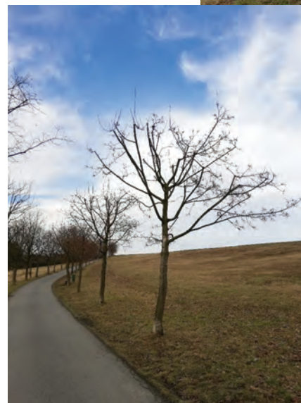
U 14 stromů ořezaných redukčním obvodovým řezem na ulici Stádlo bude nutné provádět následnou pravidelnou údržbu

U některých silně poškozených dřevin ořezem bude dán podnět k řešení správního deliktu na Magistrát města Ostravy.