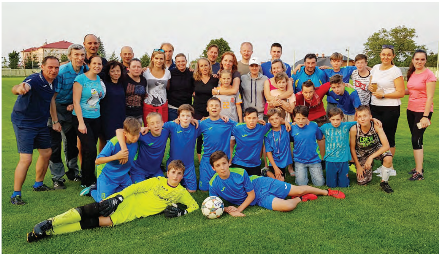
Poslední zápas starších žáků s Klimkovicemi vyhrálo naše družstvo 6 : 3 a celkově skončilo na 3. místě.