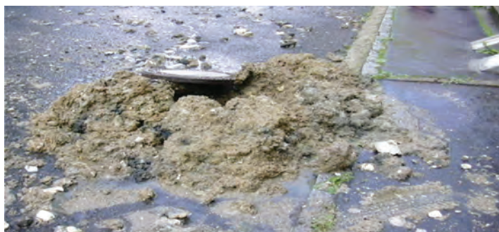
Havárie na kanalizaci v důsledku jejího ucpání tukem

Po ochlazení tuku v kanalizaci vznikají hrudky, které se postupně nabalují a zachycují do sebe další příměsi, které pak ucpávají čerpadla v čerpacích stanicích na kanalizaci, obalují sondy, které ovládají chod čerpadel a zastavují je. Tuky se v kanalizaci také částečně rozkládají, vznikají mastné kyseliny a ty zvyšují korozi stěn kanálů a potrubí. V extrémních případech vznikne tuková zátka a dojde k úplnému ucpání kanalizace. Následně musí provozovatel vodohospodářské infrastruktury provést čištění kanalizace kombinovanými tlakovými vozy, které materiál včetně tuků rozruší a uvede kanalizaci do průtočného stavu. Stejně tak tuk působí i problémy v samotném procesu čištění na čistírnách odpadních vod a to tím, že prochází čistírnou a zhoršuje proces čištění vlastnosti aktivovaného kalu a následně tedy i odtokové parametry.