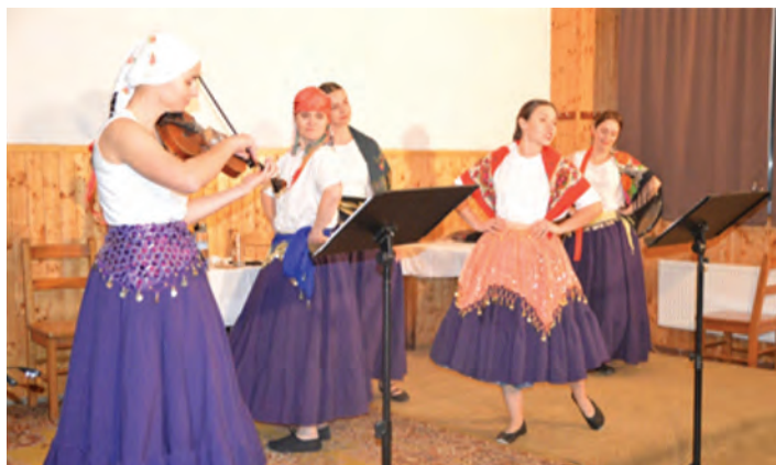
A hodně veselé vystoupení Krasnických děvuch.

text Marek Plhák