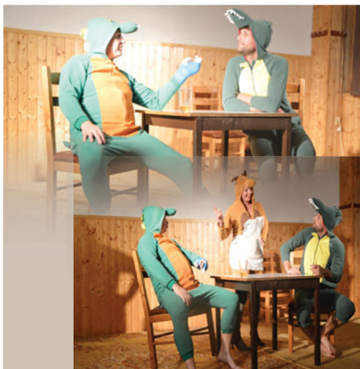
A nakonec čiré Dada v podání dobroslavických ochotníků. Duch Tristana Tzary a Kabaretu Voltaire se nečekaně zjevil o jednom sobotním podvečeru v Krásném Poli. Tahle scénka byla opravdu hodně nečekaná.