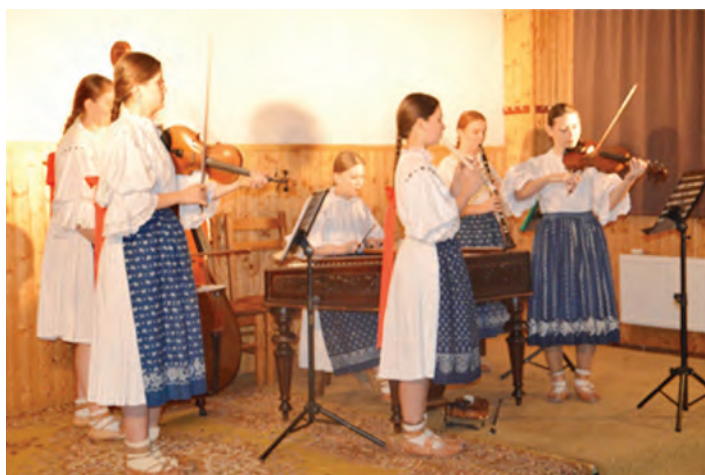
A jako každý rok folklór. Dívčí cimbálová muzika Hlubinka.